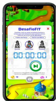
Atividades físicas indoor ou ao ar livre