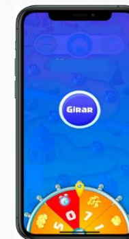
Sorte na roleta