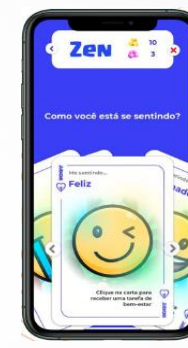
Atividades de bem-estar