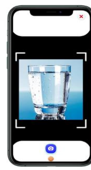
Consumo de água